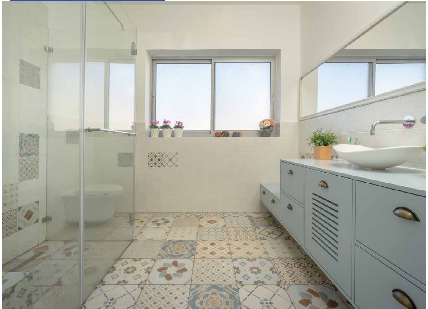
מקלחונים, מראות ועבודות זכוכית: א.מ.מראות

הדיירים שביקשו לעצמם, צבעוניות ותפיסה ייחודית בעיצוב הבית, הוסיפו גם משאלה של הפרדה ברורה בין האזור החברתי לאזור הפרטי. השוני בין שני האזורים נעשה בחלוקת החללים אך בעיקר על ידי שימוש בצבעים