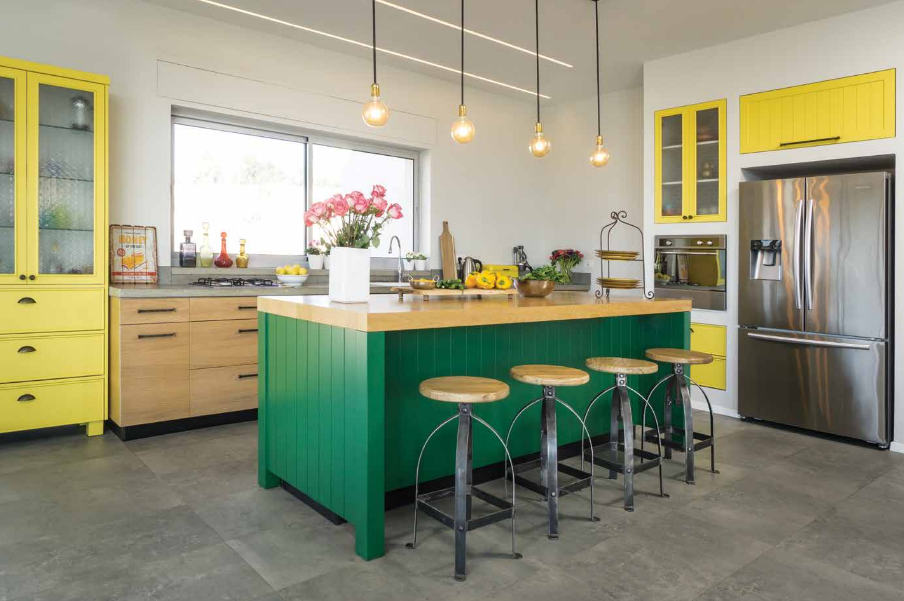
נגרות: ליבא אומנות בעץ